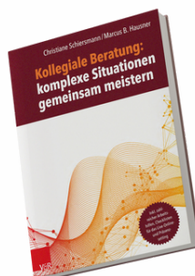
Lese- und Arbeitsbuch, 256 Seiten, inkl. umfangreiches Online-Material