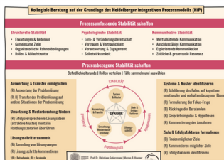
Lernkarte (DIN A5) als praktische Begleiterin mit allen wichtigen Infos

Für die praktische Anwendung stehen Ihnen erprobte Arbeitshilfen zur Verfügung, die das Erlernen und das Praktizieren kollegialer Beratungsprozesse im Arbeitsalltag erleichtern werden.