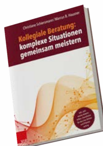
Lese- und Arbeitsbuch, 256 Seiten, inkl. umfangreiches Online-Material