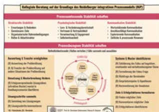
Lernkarte (DIN A5) als praktische Begleiterin mit allen wichtigen Infos

Für die praktische Anwendung stehen Ihnen erprobte Arbeitshilfen zur Verfügung, die das Erlernen und das Praktizieren kollegialer Beratungsprozesse im Arbeitsalltag erleichtern werden.